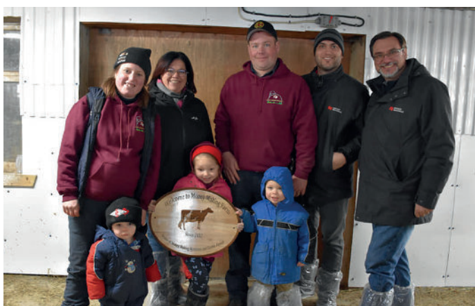
PRÉSENTATION DU CADEAU SOUVENIR À LA FAMILLE SYLVESTRE-SCOBLE DE LA FERME MONEY-MAKING