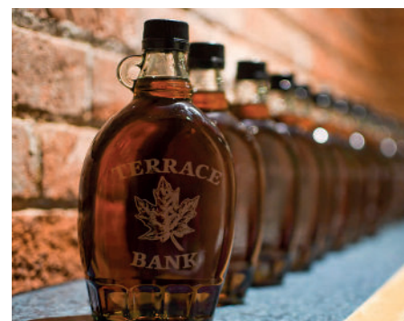
SIROP D'ÉRABLE GÉNÉREUSEMENT OFFERT PAR LA FERME TERRACE BANK À TOUTS LES PARTICIPANTS DE L'AGA D'AYRSHIRE CANADA.

Vous pourrez avoir accès à tous les résultats de production et de reconnaissances sur le site internet d'Ayrshire Canada