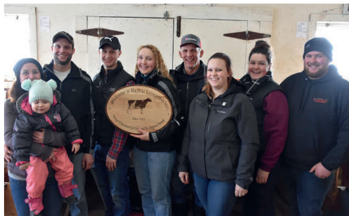
PRÉSENTATION DU CADEAU SOUVENIR À LA FAMILLE MACFARLANE DES ENTREPRISES MARBRAE

éleveurs pour la première fois : le préfixe Guimond de la Ferme Guimond et Fils de Ste-Blandine, et le préfixe Pierre Bleu de La Ferme Pierre Bleu de St-Agapit (Québec). Les préfixes Du Petit Lac de la Ferme Coubert (1987) de Compton (Québec) et Forever Schoon de la Ferme Forever Schoon inc. de Vernon-Bridge (Î.-P.-É.) remportent ce prestigieux titre pour la seconde fois.