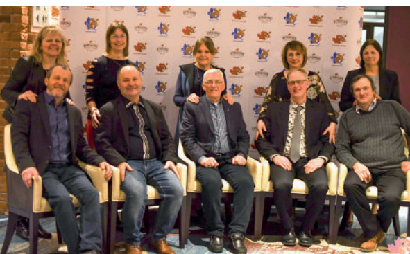
EN ATTENDANT LE DÉBUT DU BANQUET, ON S'OFFRE UNE PETITE PAUSE

Le congrès annuel marque aussi la reconnaissance des hautes performances en production. L'Association soulignait la nomination de deux troupeaux Maîtres-